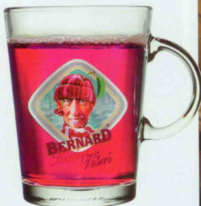
▲▼ Švestkové nebo višňové pivo Bernard svaříme s kouskem skořice a dvěma hřebíčky